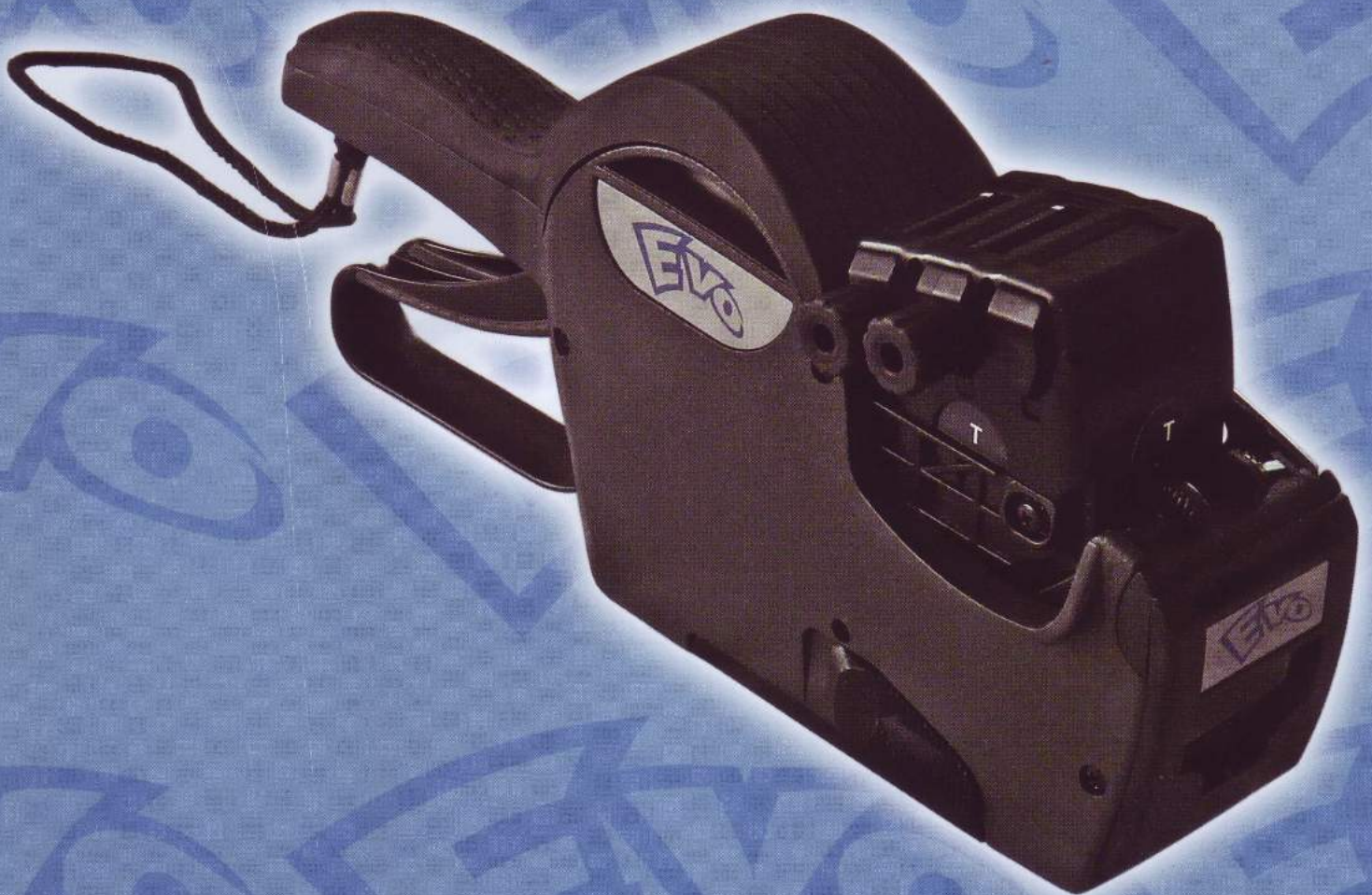
Griff mit Weichgummi überzogen